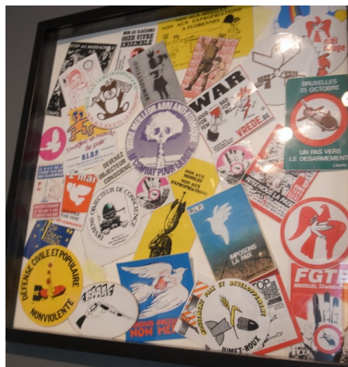
Foto's uit tentoonstelling "Give Peace a Change, Gent mei - juni 218, georganiseerd door www.vrede.be